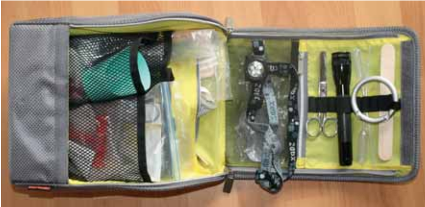
■ Abb. 1: Utensilobox® KDZ – „Werkzeugkoffer“ für Diagnostik und Therapie

Angehörigen als schwierig, bedrohlich oder gar unmöglich beschrieben.